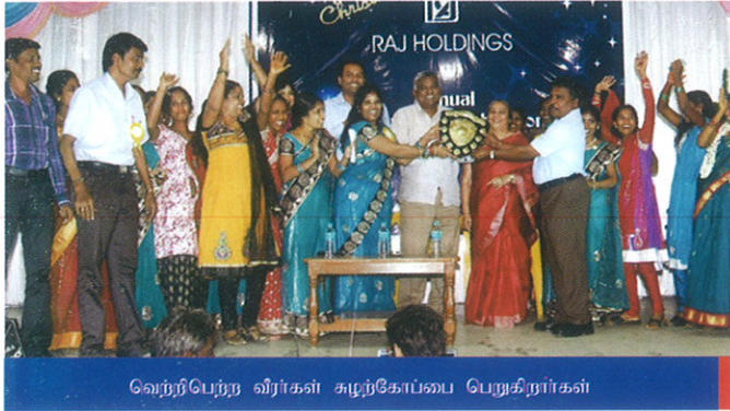
வெற்றிபெற்ற வீரர்கள் சமுதேயத்தை பெறுகிறார்கள்

ஒவ்வொரு ஆண்டும் ஊழியர்கள் மற்றும் பணியாளர்கள் எதிர்பார்த்து காத்துக் கொண்டிருக்கும் நிகழ்ச்சியாகிய "கிறிஸ்துமஸ் விழா". நமது நிறுவனத்தில் 15.12.2012 அன்று சிறப்பாக கொண்டாடப்பட்டது.