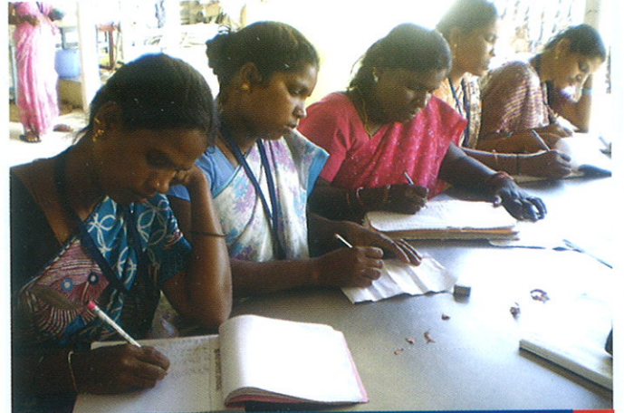
புகைப்படம்: அழிஞ்சிவாக்கத்தில் நடைபெற்ற வகுப்புகள்.

இதில் பங்கேற்கும் பணியாளர்கள் வாரம் ஒருமுறை தமிழ் எழுதப்படிக்க, எண்களை கூட்டல், ATM Card பயன்படுத்துதல்,