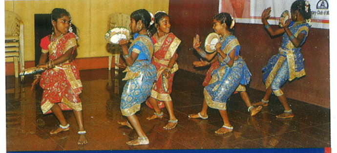
புகைப்படம்: MCTM பள்ளியில், குழு நடனம் சிறப்பாக ஆடும் செம்பாச்சி குப்பம் பள்ளியின் 5ஆம் வகுப்பு மாணவிகள்