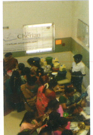
புகைப்படம்: அறிஞ்சிவாக்கத்தில் மலிவான பொருட்கள் விற்பனை

புதியதாக இவ் வருடம், நலப்பணிகளுக்கான நிதி திரட்டும் நிகழ்ச்சியாக "மலிவான பொருள் விற்பனை / கதம்ப விற்பனை (Jumble Sales)" சிறப்பாக நடைபெற்றது. இந்த நிகழ்வுக்கு பல நலம் விரும்பிகள் மற்றும் ஊழியர்கள் துணிகள், விளையாட்டு சாதனங்கள், வீட்டு உபயோக பொருட்கள் போன்றவற்றை நன்கொடையாக வழங்கினார்கள். இதன் மூலம் பணியாளர்கள் நமது நிறுவனத்தின் நலத்திட்டங்களில் பங்கேற்கும் வாய்ப்பை உருவாக்கியுள்ளது. இதில் ரூ. 31,879 நிதி திரட்டப்பட்டுள்ளது.