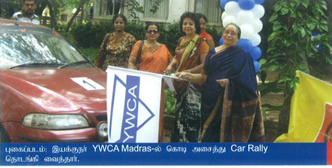
புகைப்படம்: இயக்குநர் YWCA Madras-ல் கொடி அசைத்து Car Rally தொடங்கி வைத்தார்.