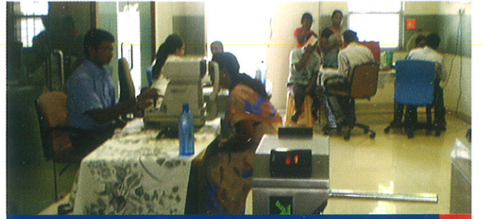
புகைப்படம்: ராஜ் கண் மருத்துவமனை பங்களிப்பு கண் பரிசோதனை செய்திறார்கள்.

இலவச கண் மருத்துவ முகாம் கீழ்க்காணும் இடங்களில் நடைபெற்றது: 14.07.2012 அன்று ராஜ் குளோபல் ஹோல்டிங்ஸ், தி.நகர் இதில் 52 பேர் பயன் பெற்றனர்.