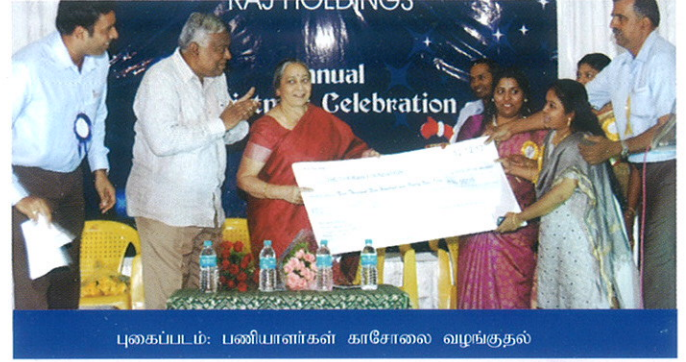
புகைப்படம்: பணியாளர்கள் காசோலை வழங்குதல்