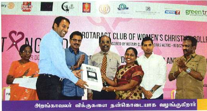
அறங்காவலர் விக்குகளை நன்கொடையாக வழங்குகிறார்

இத்திட்டம் உலக புற்று நோய் தினம் 2014 அன்று பெண்கள் கிறிஸ்துவ கல்லூரியின் Rotaract குழுமம், ராஜ் ஹேர் இன்டர்நேஷனல் மற்றும் கிரீன் டிரென்ட்ஸ் சலூன் இணைந்து தொடங்கினார்கள். கிரீன் டிரென்ட்ஸ் சலூன்களில் முடிகள் சேகரிக்கப்பட்டு, ராஜ் ஹேர் இன்டர்நேஷனலில் விக்குகள் தயாரிக்கப்படுகின்றன. இத்திட்டம் தமிழ்நாடு மட்டுமல்லாமல் பிற மாநிலத்திலும் 3500-க்கும் மேற்பட்டோர் தங்கள் முடியை தானம் செய்தார்கள். 2014-ல், இத்திட்டத்தின் மூலமாக 120 விக் குகளை புற்றுநோயாளிக் கு இலவசமாக வழங்கியுள்ளோம்.