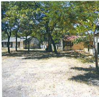
தூய்மையாக காட்சியளிக்கும் பள்ளி வளாகம்