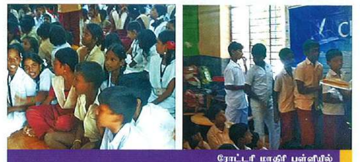
ரோட்டர் மாதிரி பள்ளியில்

டிசம்பர் 23, 2015 அன்று 141 மாணவர்களுக்கு கிறிஸ்துமஸ் கேக் வழங்கப்பட்டது. மாணவர்கள் கேரல் பாடல்கள் பாடி, தங்களது வாழ்த்துக்களையும், நன்றிகளையும் அறங்காவலர்களுக்கு தெரிவித்தனர்.