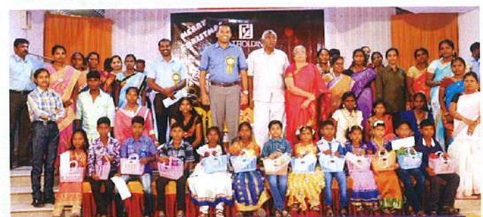
அறங்காவலர்களுடன் பயனாளிகள் மற்றும் அவர்களது பெற்றோர்

கடந்த ஆண்டு, 75 விண்ணப்பங்கள் பெற்றோம். இதில் 90 சதவீதத்திற்கு மேல் மதிப்பெண் பெற்ற 21 மாணவர்கள் தேர்வு செய்யப்பட்டனர். ராஜ் ஹோல்டிங்ஸ் கிறிஸ்துமஸ் கொண்டாட்டத்தின் போது, இவர்களுக்கு கல்வி உதவி தொகை (மொத்தம் ரூ 27,000/-) மற்றும் பரிசுப் பொருட்களும் வழங்கப்பட்டன.