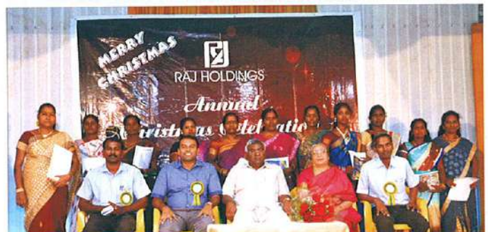
அறங்காவலர்களுடன் கல்வி பயின்ற பயனாளிகள்

ராஜ் ஹோல்டிங்ஸ் நிறுவனத்தின் 2015-ம் ஆண்டு கிறிஸ்துமஸ் கொண்டாட்டத்தின் போது எழுத்தறிவு திட்டத்தில் சிறப்பாக பயின்ற 12 நபர்களுக்கு சான்றிதழும், பரிசு பொருளும் வழங்கி ஊக்குவிக்கப்பட்டது.