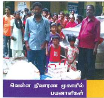
வெள்ள நிவாரண முகாமில் பயனாளிகள்