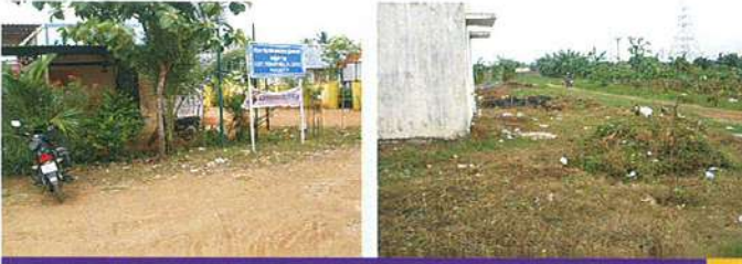
புதர்களை நீக்கி, மருத்துவ வளாகம் அழகுப்படுத்தப்பட்டது

ஆரம்ப சுகாதார மையத்தை நவீனமயமாக்குதல் பொன்னேரி அருகே பஞ்செட்டி கிராமத்தில் அமைந்துள்ள ஆரம்ப சுகாதார மையத்தின் தேவைகளை பூர்த்தி செய்யுமாறு மருந்துவர்கள் முறையீடு அளித்தார். நமது நிதி திரட்டு நிகழ்ச்சியின் மூலமாக, பின் வரும் வசதிகளை ஏற்படுத்திக் கொடுத்துள்ளோம்.