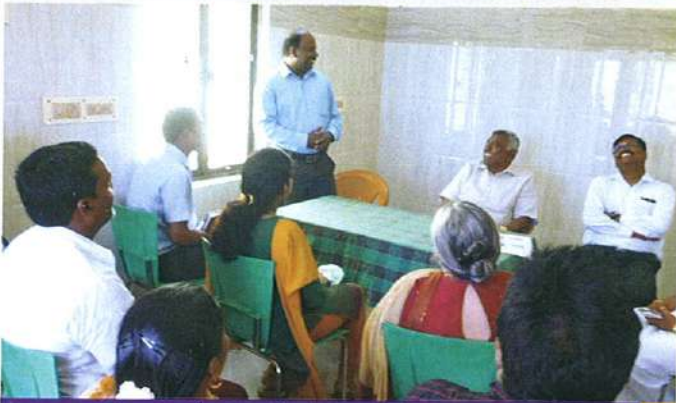
நிறுவன நிர்வாகிகள் மற்றும் மருத்துவ குழுவுடன் சந்திப்பு