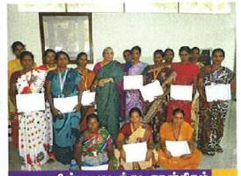
புதிய வகுப்பில் பயில்பவர்கள்