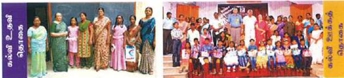
ஆரம்ப காலகால அமைப்புகள் நவீனப்படுத்துதல்