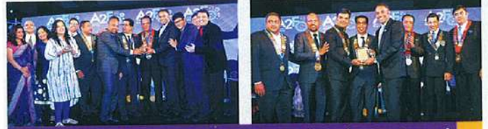
MMRT -42 வில் செயல்படுத்தப்பட்ட திட்டங்களுக்கான விருதுகள்