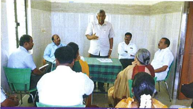
மேலான்மை அறங்காவலர் PHC-ல் வழங்கப்பட்டுள்ள வசதிகளை விளக்குகிறார்

M/s. HERRENKNECHT பிரைவேட் லிமிடெட் நிர்வாகிகள், பஞ்சாயத்து தலைவர், வட்ட கவுன்சிலர், டாக்டர்கள் மற்றும் சுகாதார கண்காணிப்பாளர் அவர்களுடன் ஒரு சிறப்பு சந்திப்பு மருத்துவமனை வளாகத்தில் நவம்பர் 5, 2015 அன்று நடைபெற்றது. இந்நிகழ்ச்சியில் ராஜ் ஹேர் இன்டர் நேசனல் பி. லிமிடெட் பணியாளர்கள் நன்கொடையாக கொடுத்த தொகை ரூ. 10,300/-யை பங்களிப்பாக தொழிற்சாலை மேலாளர் அவர்கள் வழங்கினார்.