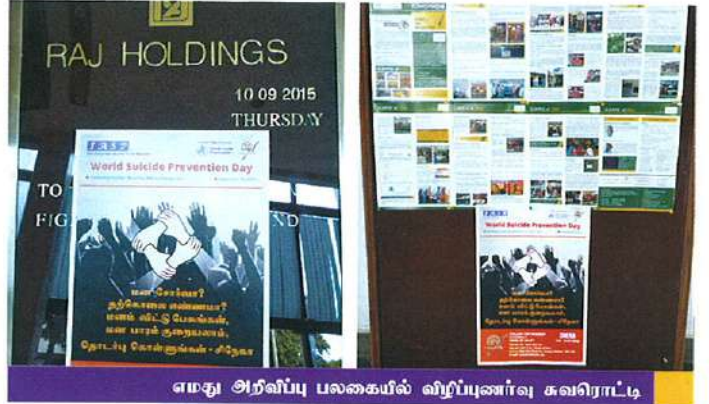
எமது அறிவிப்பு பலகையில் விழிப்புணர்வு கவிராட்டி

உலகளவில் ஒவ்வொரு ஆண்டும் செப்டம்பர் 10-ம் தேதி உலக தற்கொலை முயற்சி தடுப்பு தினமாக அனுசரிக்கப்படுகிறது. “தற்கொலை தடுத்தல்: உயிர்களை காப்பாற்றுதல்” என்ற தலைப்பை சர்வதேச தற்கொலை தடுப்பு சங்கம் மற்றும் உலக சுகாதார அமைப்பும் மையமாக கொண்டு இவ்வாண்டு செயல்படுகிறது. இந்த நாளில் சுவரொட்டிகள் மற்றும் துண்டு பிரசுரங்களை விநியோகித்தும் விழிப்புணர்வு ஏற்படுத்தினோம். தேவையான உபகரணங்கள் வழங்கிய சிநேகா .பவுண்டேஷனுக்கு எங்களது மனமாற்றத்தினை நன்றி.