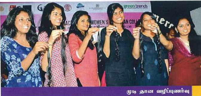
முடி தான வழிப்புணர்வு

இதை தவிர, அதிகார பூர்வமாக வெளி நாடுகளிலிருந்து நன்கொடை பெறவும், விழிப்புணர்வு ஏற்படுத்தவும் நமது தி செரியன் .பவுண்டேஷன் செயல்பட்டு வருகிறது. 2015 ஆம் ஆண்டு, இத்திட்டத்தை நுங்கம் பாக்கத்தில் உள்ள பெண்கள் கிறிஸ்துவ கல்லூரியில் நடிகர் சரத் குமார் அவர்களால் ஜனவரி 29, 2015, அன்று தொடங்கப்பட்டது. முடி தான வழிப்புணர்வு பிப்ரவரி மாதம் முதல் இரண்டு வாரங்கள் நடைபெற்றது. இதன் மூலமாக 250 விக்குகள் செய்யும் அளவிற்கு முடிகளை பெற்றோம்.