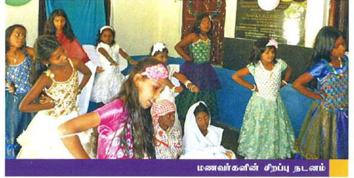
மணவர்களின் சிறப்பு நடனம்