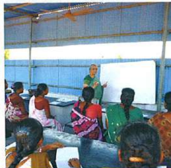
முகப்பேரில் நடைபெறும் வகுப்பு