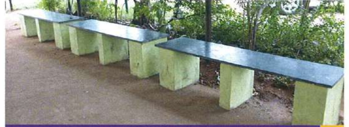
புறநோயாளி காத்திருக்கும் பகுதியில் கூடுதல் இருக்கைகள்