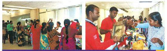
அழிச்சீவாக்கத்தில் தொண்டு பஜார்

ஒவ்வொரு ஆண்டும், தி செரியன் .பவுண்டேஷன் தொண்டு பஜார் என்ற நிதி திரட்டும் நிகழ்ச்சியை நடத்தி, அதில் கிடைக்கும் வருவாயை கொண்டு பல நலத்திட்டங்களை செயல்படுத்தி வருகிறது. இதற்கு நன்கொடையாக பொருட்கள் வழங்கிய உங்கள் அனைவருக்கும் தி செரியன் .பவுண்டேஷன் அறங்காவலர்களின் சார்பாக எங்களது உளமார்ந்த நன்றியினை தெரிவித்துக் கொள்கிறோம். தங்களின் உதவியினால் எங்களால் ரூ.1,09,172.00 நிதி திரட்டப்பட்டது.