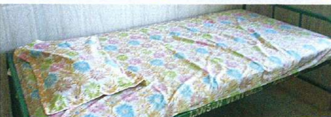
படுக்கை விரிப்புகள் மற்றும் தலையணை உறைகள்