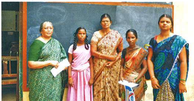
கியக்குநர் மாணவி கலையரசிக்கு உதவித் தொகை வழங்குதல்

இவ்விரண்டு மாணவிகளும் பொருளாதாரத்தில் பின்தங்கிய குடும்பத்தை சார்ந்தவர்கள். இவர்களுக்கு ஜூலை 22, 2015 அன்று கல்வி உதவி தொகை வழங்கப்பட்டது. இவர்கள் பள்ளிப்படிப்பு முடியும் வரை இக்கல்வி உதவி தொகை அளிக்கப்படும்.