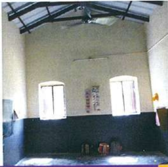
சீரமைப்பு வேலை நடைபெறும் போது