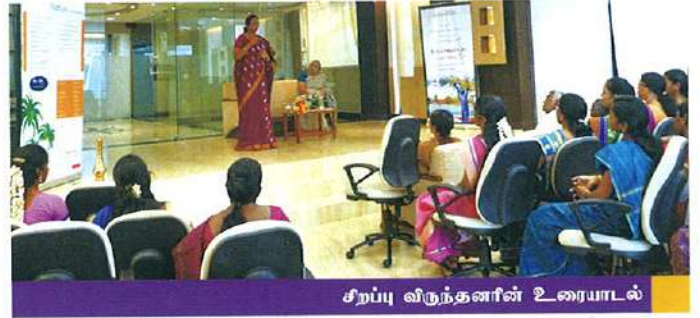
சிறப்பு விருந்தினர் உரையாடல்