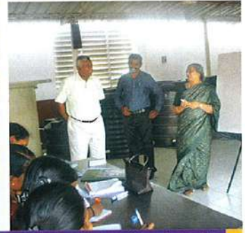
அழிஞ்சிவாக்கத்தில் நடைபெறும் வகுப்பு