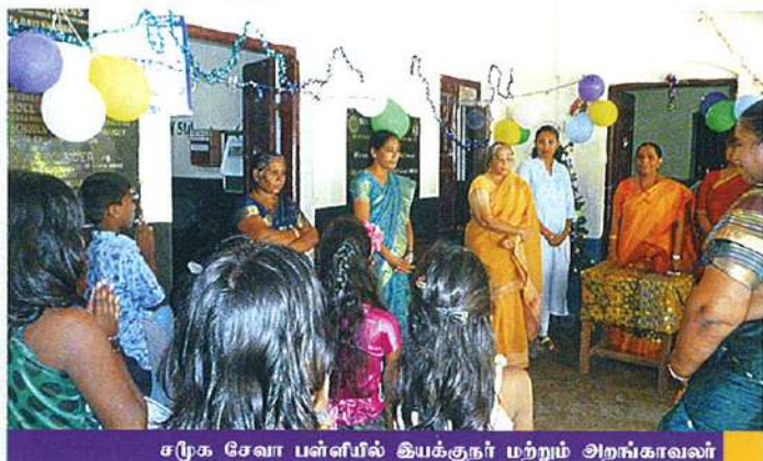
சமூக சேவா பள்ளியில் இயக்குநர் மற்றும் அறங்காவலர்

டிசம்பர் 22 2015, அன்று இராணி மேரி கல்லூரி முதல்வர், சமூக சேவா பள்ளியின் திருபூர், கல்லூரி பேராசிரியர்கள் மற்றும் 30 குழந்தைகளுடனும் கிறிஸ்துமஸ் விழா கொண்டாடப்பட்டது. இத்தருணத்தில் குழந்தைகளுக்கு பாய், படுக்கை விரிப்பு, தலையணை உறை, துண்டு, டெட்டால் சோப்பு, நோட்டு புத்தகம், பென்சில், பேனா, ஷார்பனர் மற்றும் ரப்பர் ஆகியவற்றை வெள்ள நிவாரண பொருளாக வழங்கப்பட்டது.