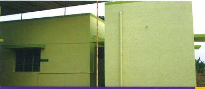
பெயின்ட் அடித்தபின் மருந்துவமனையின் வெளிப்புறம்