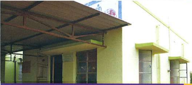
பெயின்ட் அடித்தபின் மருந்துவமனையின் முகப்பு