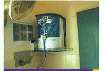
தண்ணீர் சுத்திகரிக்கும் கருவி