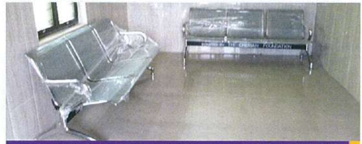
3 இருக்கைகள் கொண்ட இரு நாற்காலிகள் மற்றும் மின்வீசிறி

இத்திட்டத்திற்கு உதவிய நிதி திரட்டும் நிகழ்வுகள்