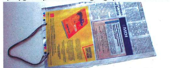
பழைய செய்திதாளில் செய்யப்பட்ட காகித பை

எழுத்தறிவு பயிலும் பணியாளர்களின் உதவியுடன் அழிஞ்சிவாக்கத்தில், சானிடரி நாப்கின்களை சரியான முறையில் அப் புறப் படுத்த, காகித பைகளை உருவாக்கினோம். இக்காகித பைகள் அனைத்தும் கழிப்பறையில் வைக்கப்பட்டுள்ளன. தேவைகளுக்கு ஏற்ப தொடர்ந்து காகித பைகளை செய்து வருகிறார்கள்.