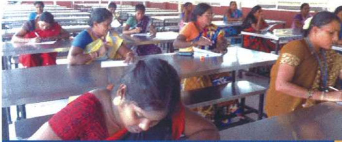
அழிஞ்சிவாக்கத்தில் நடைபெற்ற தேர்வு

இந்த திட்டத்தின் மூலம், அழிஞ்சிவாக்கத்தில் 20 பெண்களும் மற்றும் முகப்பேரில் 10 பெண்களும் பயனடைந்தனர். அவர்களின் கல்வி முன்னேற்றத்தை அறியும் வகையில் முறைப்படி தேர்வுகள் நடத்தப்பட்டன. தற்போது இவர்கள் எழுத, படிக்க மற்றும் பணி இடத்தில் உள்ள கோப்புகளை பராமரிக்கவும் செய்கிறார்கள்.