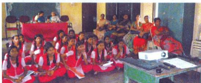
மின் கற்றல் கிட்டின் செயல் விளக்கம்

கல்வியின் தரத்தை உயர்த்தவும், நடைமுறை மொழியில் பயிலவும், பாடத்திட்டத்தின் அடிப்படையில் காட்சி வாயிலாக மாணவர்களுக்கு பாடங்களை புரிந்து கொள்ள, சிந்திக்க, ரோட்டரி இந்தியாவின் எழுத்தறிவு மிஷனின் ஒரு முயற்சியான மின் கற்றலின் நோக்கமாக உள்ளது. தமிழ்நாடு அரசு மற்றும் அரசு உதவி பெறும் பள்ளியின் "சமசீர் கல்வி" பாடத்திட்டத்தின் அடிப்படையில் மின் கற்றல் பாடங்கள் உள்ளன. செப்டம்பர் 21, 2016 - அன்று குண்தீர் சுப்பையா பள்ளியில் பயிலும் 11-ம் வகுப்பு மாணவிகளுக்கு மின் கற்றல் கிட்டின் செயல் விளக்கம் அளிக்கப்பட்டது. மேலும், தி செரியன் பவுண்டேஷன் இயக்குநர் அவர்கள் மாணவர்களுடன் கலந்துரையாடி கருந்துகளை கேட்டறிந்தார்.