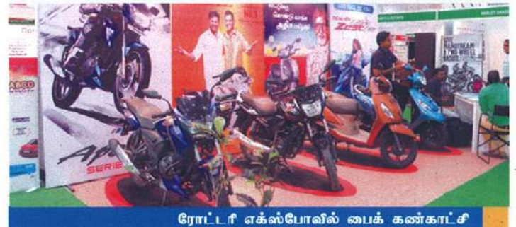
ரோட்டரி எக்ஸ்போவில் பைக் கண்காட்சி