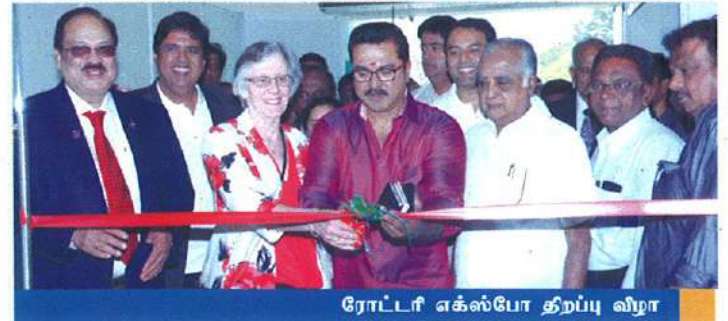
ரோட்டரி எக்ஸ்போ திறப்பு விழா