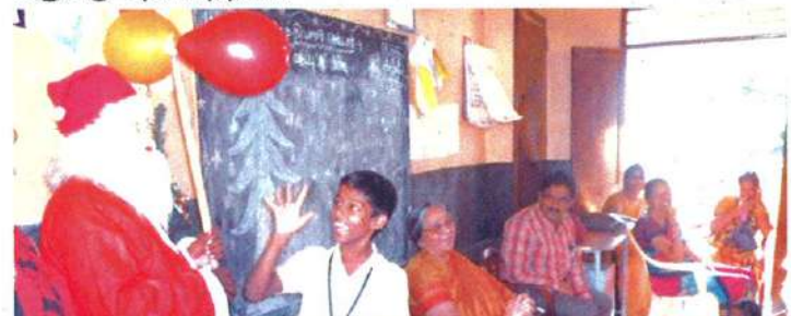
மாணவர்களின் சிறப்பு நடன நிகழ்ச்சி

181 மாணவர்களுக்கு டிசம்பர் 23, 2015 - அன்று கிறிஸ்துமஸ் கேக் வழங்கப்பட்டது. மாணவர்கள் கேரல் பாடல்கள் பாடி, தங்கள் வாழ்த்துதலையும், நன்றியையும் அறங்காவலர்களுக்கு தெரிவித்தனர்.