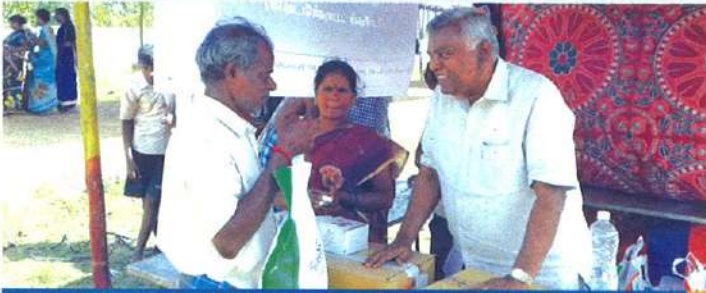
அறங்காவலர்கள் பயனாளியுடன் கலந்துரையாடுகிறார்

டிசம்பர் 2015-ல் வெள்ளத்தால் பாதிக்கப்பட்டவர்களுக்கு உதவும் வகையில் நிவாரணப் பொருட்கள் கொண்ட கிட்டயரித்தோம். ஒவ்வொரு கிட்டிலும் உள்ள பொருட்கள்: 5 கிலோ அரிசி, 1 கிலோ பருப்பு மற்றும் 5 குளியல் சேப். கீழார்க் கொல்லை உள்ள குடும்பத்திற்கு ஜனவரி 3, 2016 மற்றும் தென்பட்டினம் கிராமத்தில் உள்ளவர்களுக்கு ஜனவரி 9, 2016 அன்றும், இந்நிவாரணப் பொருட்கள் வழங்கப்பட்டது. இதன் மூலம் 377 குடும்பங்கள் பயனடைந்தார்கள்.