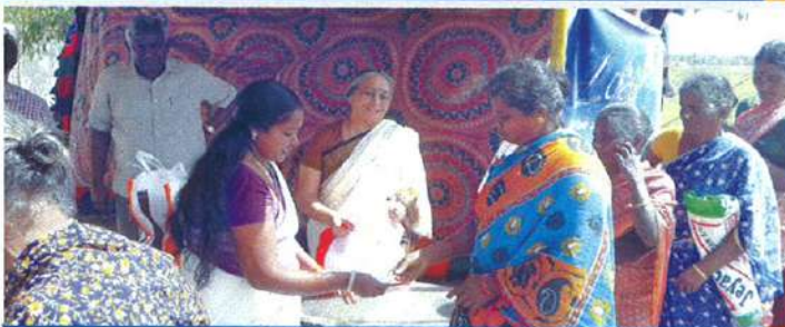
வெள்ள நிவாரண பொருட்களை வழங்குதல்