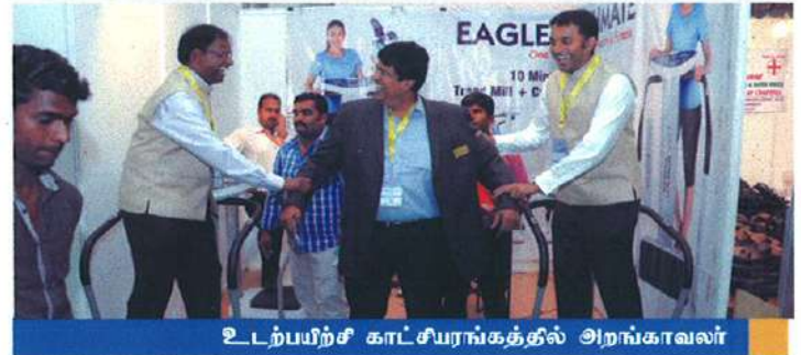
உடற்பயிற்சி காட்சியரங்கத்தில் அறங்காவலர்