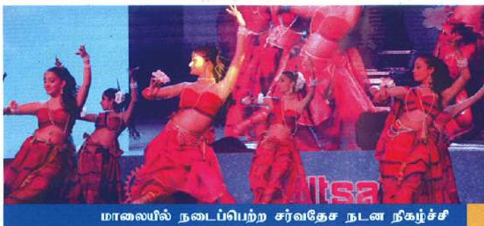
மாலையில் நடைபெற்ற சர்வதேச நடன நிகழ்ச்சி