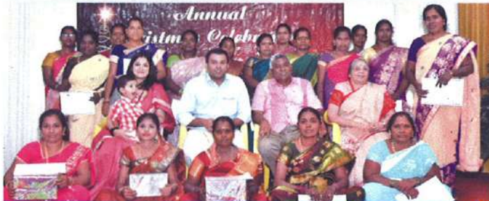
சிறந்து விளங்கிய எழுத்தறிவு திட்ட பயனாளிகள்

அழிஞ்சிவாக்கத்தில் 10 பெண்களும் மற்றும் முகப்பேரில் 8 பெண்களும் எழுத்தறிவு தேர்வுகளில் நல்ல மதிப்பெண்களை பெற்றனர். இவர்களுக்கு கிறிஸ்துமஸ் கொண்டாட்ட நிகழ்ச்சியின் போது சான்றிதழ்களும், பரிசுகளும் வழங்கப்பட்டது.