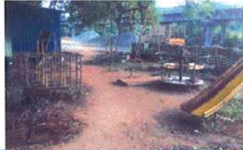
தற்போதைய பூங்காவின் நிலை