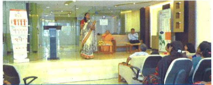
சிறப்பு விருந்தினரின் கலந்துரையாடல்