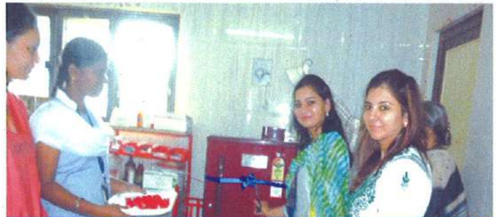
மருந்துகளை வைக்க ஸ்டொபிளைசருடன் பிரிஜ்

இந்நன்கொடை, பின்வரும் மருந்துவ உபகரணங்களை வாங்க உறுதுணையாக இருந்தது.