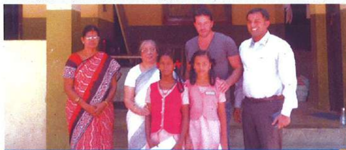
கியக்குநர் மற்றும் அறங்காவலர் - பயனாளிகளுடன்