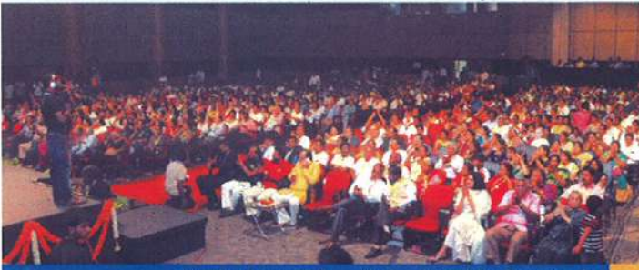
ரோட்டரி மாநாடு - உத்சவ் பங்கேற்றவர்கள்

தற்போது, வருகிற மார்ச் 2017-ல் நடைபெற இருக்கும் ரோட்டரி தெற்காசியாவில் எழுத்தறிவு மாநாடு நடைபெறும் இடத்தின் நிர்வாகப் பொறுப்பில் உள்ளார்.