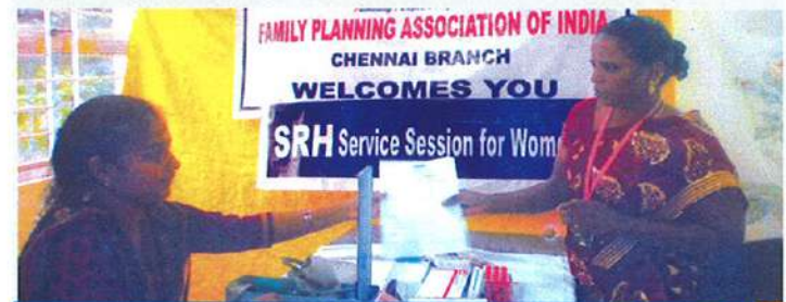
பயனாளிகள் மருத்துவ அறிக்கையும் மற்றும் கிஸ்வச மருத்துக்களை பெறுதல்

பேமிலி பிளானிங் அசோஸியேஷன் ஆப் இந்தியாவின் மருத்துவ குழுவின் உதவியுடன் கருப்பைவாய் புற்றுநோய் கண்டறியும் பரிசோதனை அழிஞ்சிவாக்கத்தில் டிசம்பர் 1, 2016 அன்று நடைபெற்றது. 35-45 வயதிற்குட்பட்ட 30 பெண்கள் இம்முகாமில் மருந்துவ பரிசோதனையில் பங்கேற்றனர். இதில், 20 பெண்கள் இரத்த மற்றும் சர்க்கரை பரிசோதனை செய்ய இ.எஸ்.ஐ. மருந்துவமனைக்கு பரிந்துரைக்கப்பட்டனர். இவர்களில் எவருக்கும் கர்ப்பப்பை வாய்ப் புற்றுநோயின் அறிகுறிகள் மற்றும் பாதிப்புகள் காணப்படவில்லை.