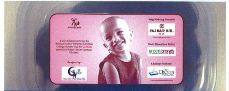
புற்றுநோய் நோயாளிகளுக்கான விக்