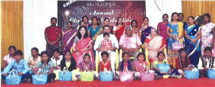
பயனாளிகளுடன் கியக்குநர் மற்றும் அறங்காவலர்கள்

இவ்வாண்டு 40 விண்ணப்பங்களை பெற்றோம். இதில் 95 சதவீதத்திற்கு மேல் மதிப்பெண்கள் பெற்ற 14 மாணவர்கள் தேர்வு செய்யப்பட்டனர் ராஜ் ஹோல்டிங்ஸ் கிறிஸ்துமஸ் கொண்டாட்டம் போது இவர்களுக்கு கல்வி உதவி தொகை (மொத்தம் ரூ.18,000.00) மற்றும் பரிசு பொருட்களும் வழங்கப்பட்டது.