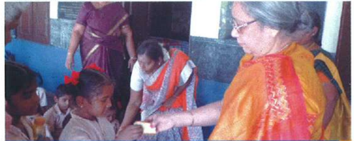
கியக்குநர் மாணவர்களுக்கு கேக் வழங்குதல்

டிசம்பர் 22, 2015, அன்று இராணி மேரி கல்லூரி வளாகத்தில் உள்ள சமூக சேவா பள்ளியில் 30 குழந்தைகளுடன் கொண்டாடப்பட்டது.